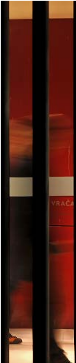
Oddelek izposoje- Koroška osrednja knjižnica dr. Franca Sušnika