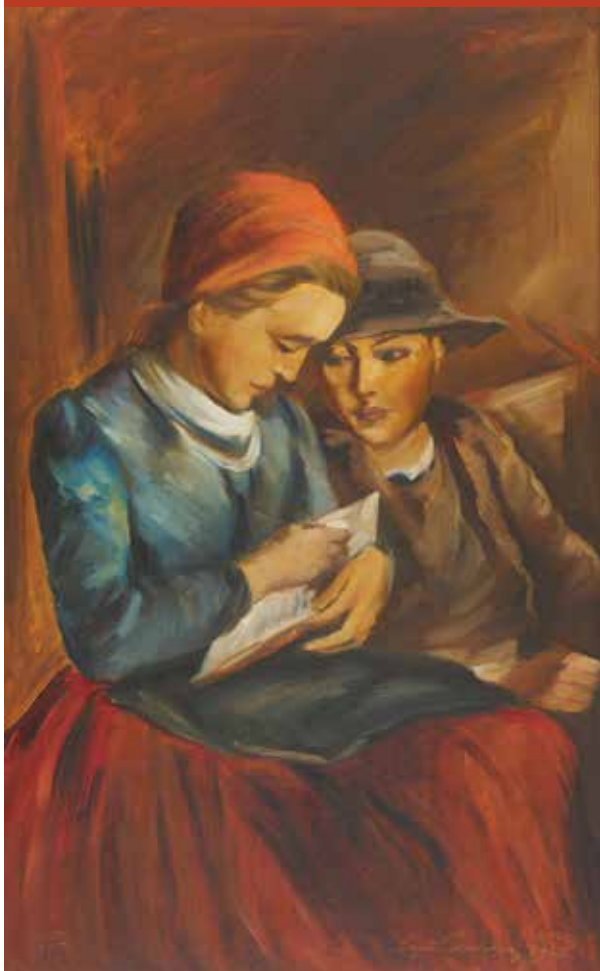
Lajči PANDUR: Pri čitanju, olje/platno, 1948 (Artoteka KOK)